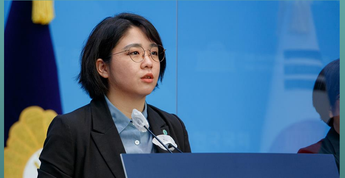
2020년 총선에서 원내 입성한 기본소득당 용혜인 상임대표