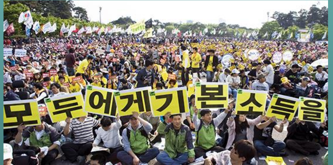
2010년, 기본소득 도입을 요구하는 사회당(Socialist Party) 당원들 "모두에게 기본소득을"