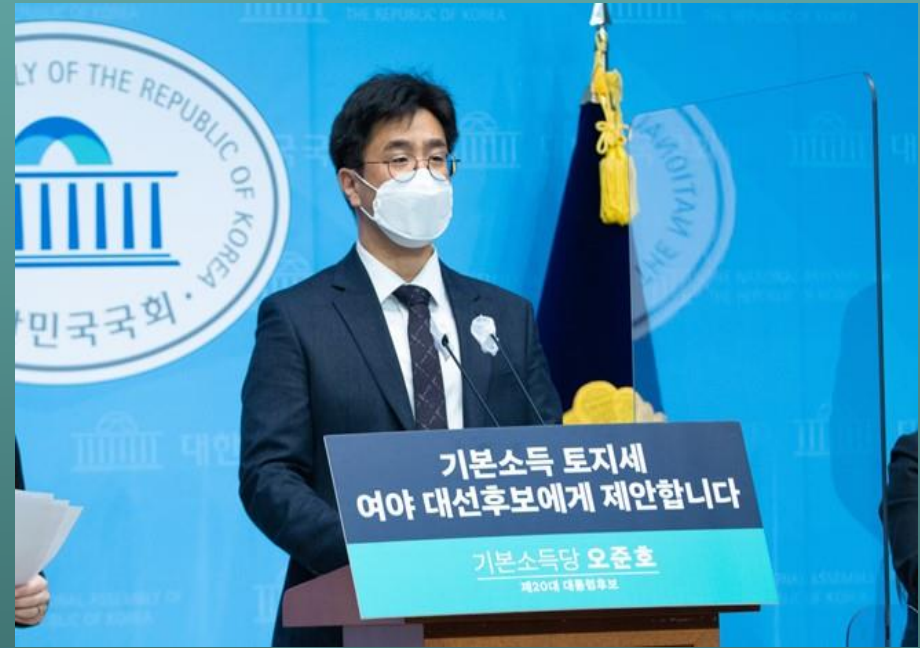
'기본소득 토지세' 정책 설명하는 오준호 기본소득당 대선 후보