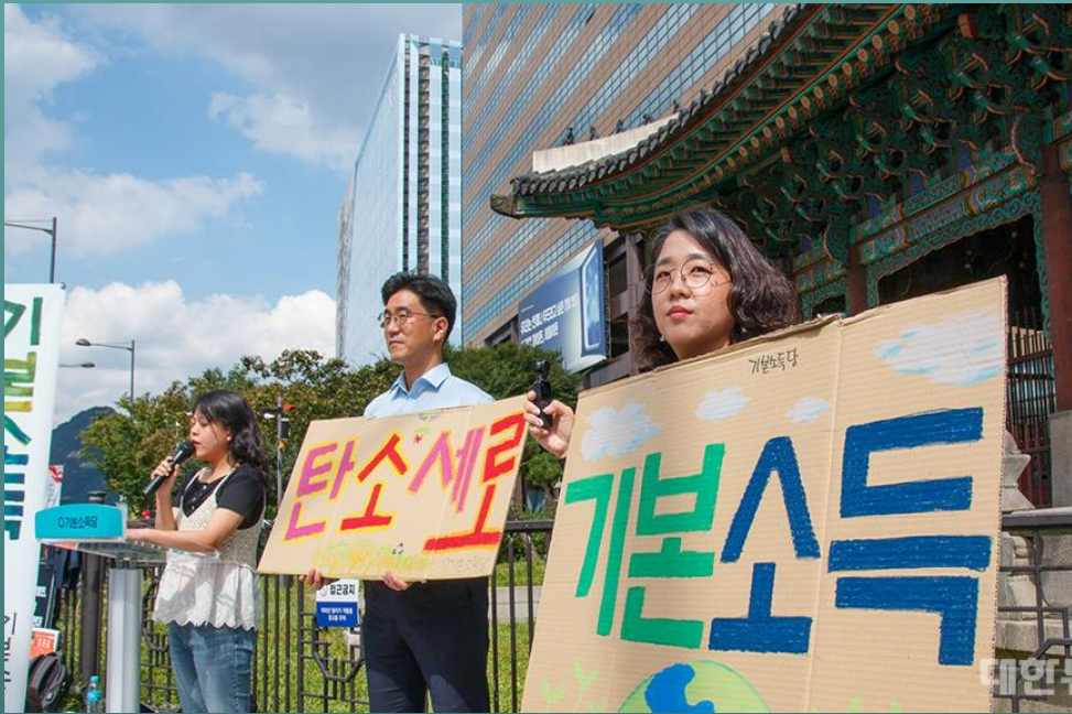
'탄소세로 기본소득' 정당연설회 중인 용혜인 기본소득당 의원