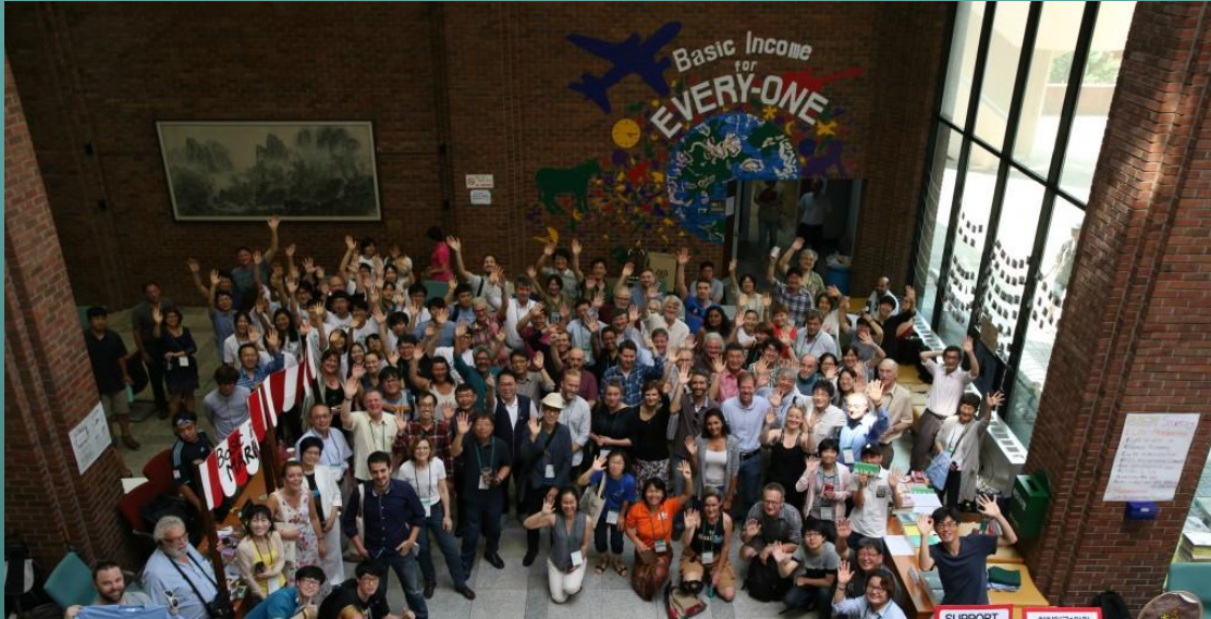
2016년 7월 서울, BIKNI이 주관한 제16차 기본소득지구네트워크 대회