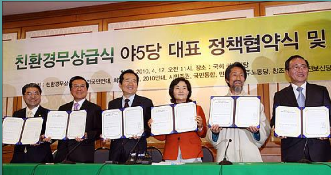
2010년 6월 지방선거를 앞두고 '무상급식' 공동 공약에 합의한 야당