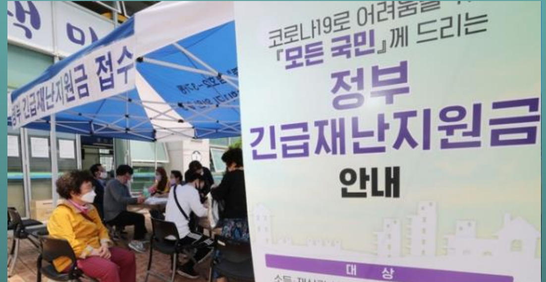
2020년 5월 정부가 코로나19 대응책으로 '전국민 재난지원금' 지급 결정